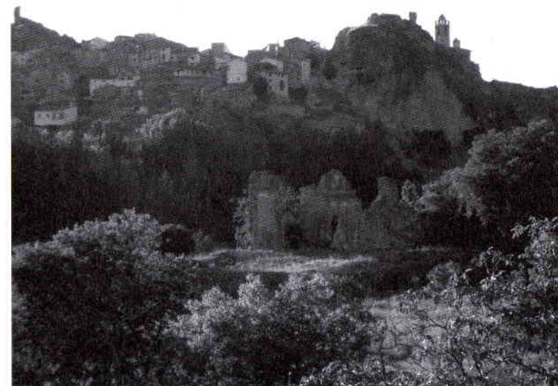
El convento franciscano de San Guillén en la actualidad, rodeado de sus antiguas huertas y separado de la villa de Castielfabib por el profundo lecho del río Ebrón.

Nueva documentación hallada recientemente nos ha permitido conocer cómo fue la última etapa de actividad de la fundación franciscana castielera, lo que obliga a reescribir y precisar lo que hasta ahora se había afirmado acerca de su historia reciente, basado fundamentalmente en bibliografía de historia general y no en fuentes documentales.